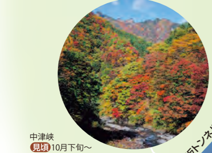
中津峡 10月下旬～11月上旬