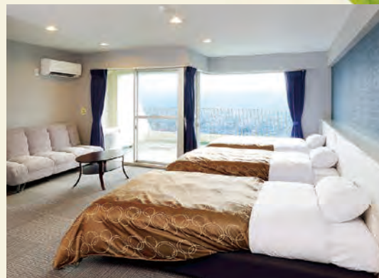
■客室(洋室トリプルノンファーベッド)

秩父市内が一望できる展望風呂。露天風呂・休憩室 泉質／重碳酸ソーダ冷泉 効能／神経痛・筋肉痛・疲労回復など