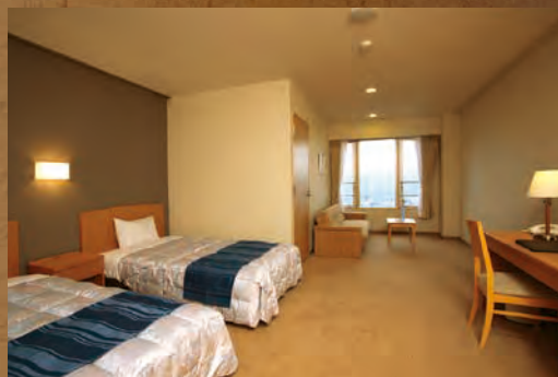
■洋室ヒューバス くつろぎのツイン