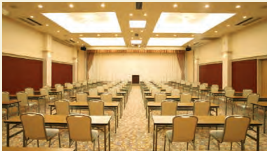
会議室「花梨の間」 447㎡(2分割可)