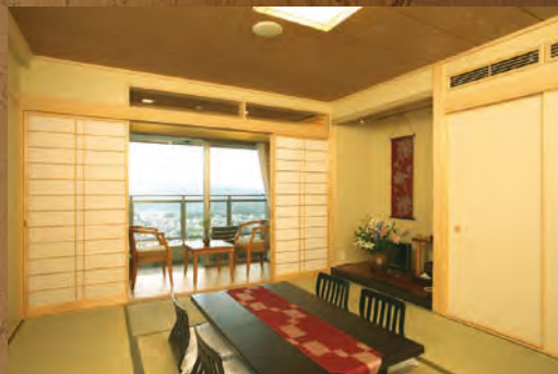
■和室 なごみの和室