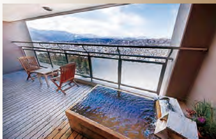
本館和洋室露天風呂

ココロをこめたおもてなしで… とき ココロからくつろげる時間をお過ごしください。