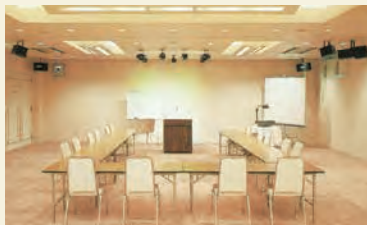
会議室「ケヤキの間」 220㎡(4分割可)

10名～300名様規模 の社員研修・セミナー・ パーティー・発表会・展示会 など幅広いご利用が 可能です。