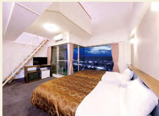
■客室(洋室フォースメゾネット)