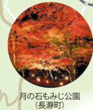
月の石もみじ公園 (長瀬町)