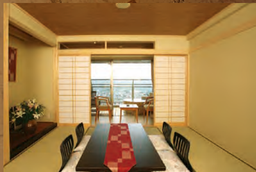
■和室露天風呂付 おちつきの和室