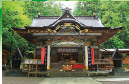
宝登山神社 (長瀬町)