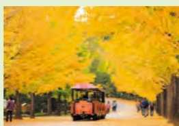
イチョウ並木 (秩父ミュージアムパーク)