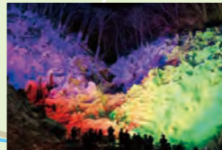
あしがくぼの水柱 (横瀬町)