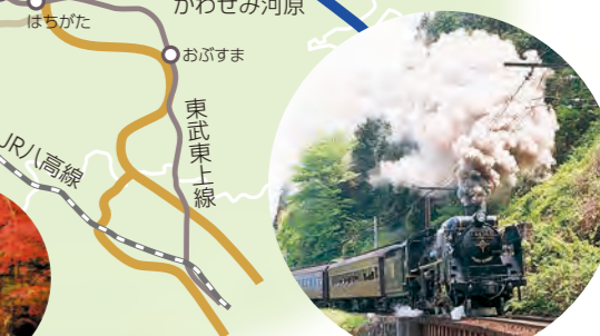
秩父路を走り抜ける SL「パレオエクスプレス」