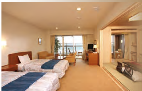
■和洋室露天風呂付 やすらぎの露天